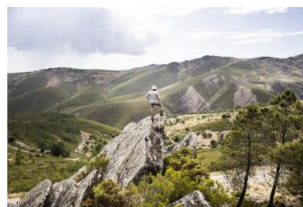
Parque Natural Montesinho NELSON GARRIDO

O novo plano de gestão do Parque Natural de Montesinho, dividido pelos concelhos de Bragança e Vinhais, encontra-se em consulta pública até 07 de julho, período durante o qual os interessados podem apresentar sugestões e reclamações.