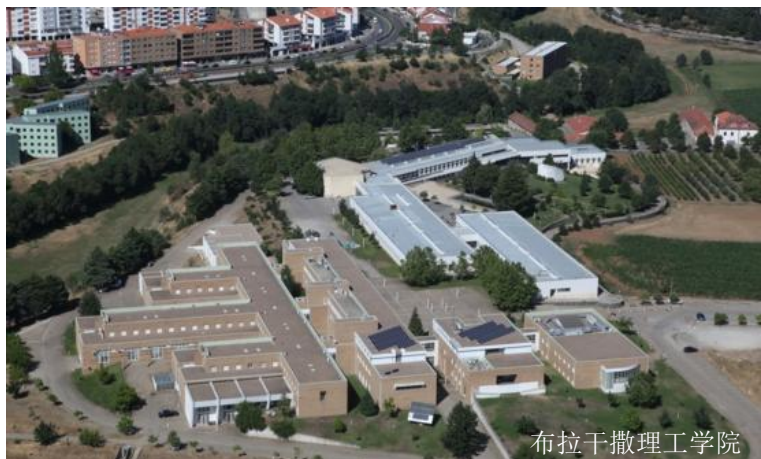
布拉干撒理工学院