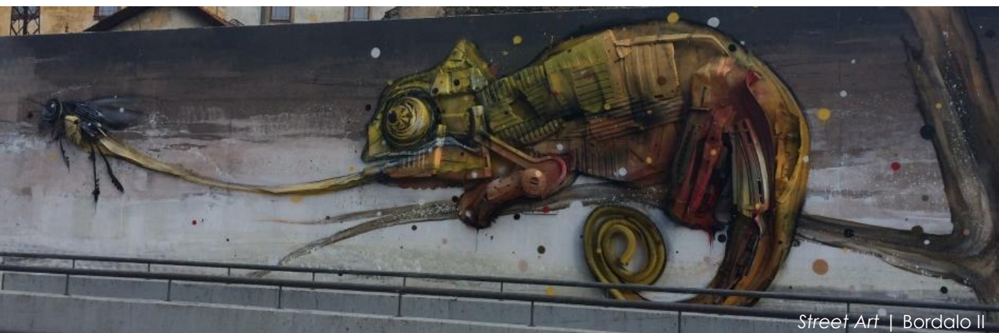
Street Art | Bordalo II