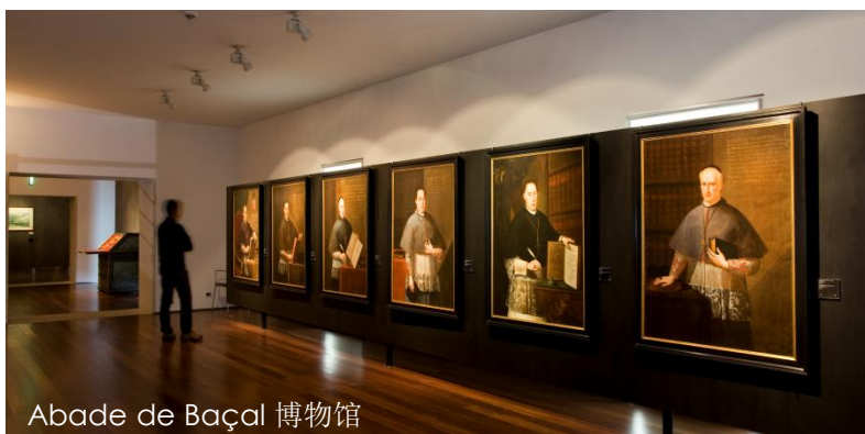
Abade de Baçal 博物馆