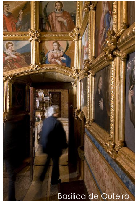
Basílica de Outeiro