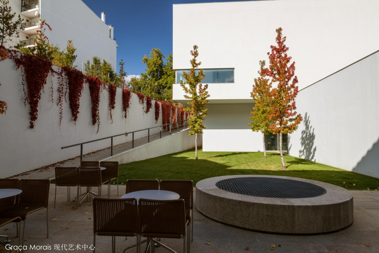
Graça Morais 现代艺术中心