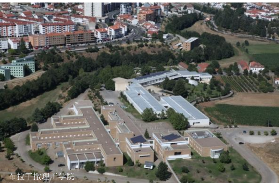
布拉干撒理工学院