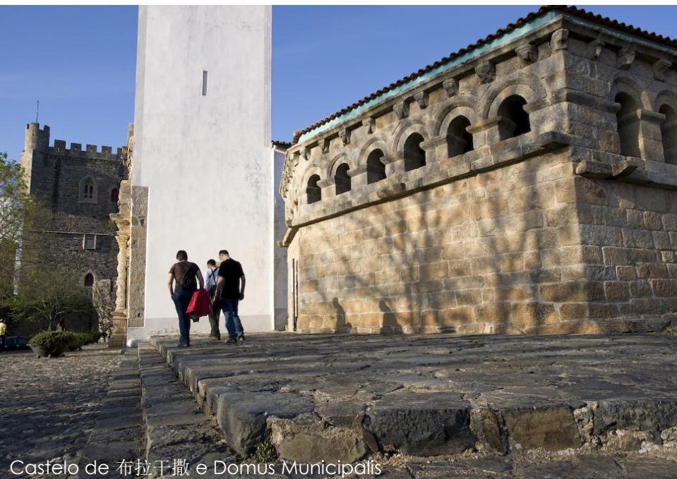
Castelo de 布拉干撒 e Domus Municipalis

布拉干萨在文化历史悠久的城市中心保留着独一无二的文化遗产，可以很方便地步行游览。它所用的石块见证了几个世纪的历史，正是在这，矗立着全国最优美和保留最完好的 15 世纪的古代城堡主楼之一的布拉干萨城堡，它庇护了一系列如古市政厅（Domus Municipalis）庄严肃穆的历史纪念性建筑物。城墙、碎石路指引着游客通向天主神殿和保留着传统习俗和建筑的小山村（Montesinhos）、里奥-迪奥努尔村（Rio Onor），这些地方都非常值得细心游览。