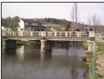
Ponte de Varge