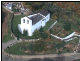
Igreja de Varge