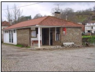
Casa do Povo de Varge