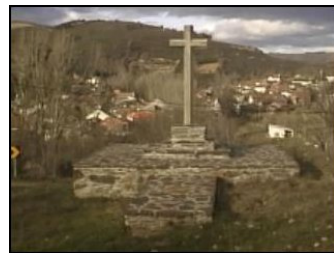
Cruzeiro da Aveleda