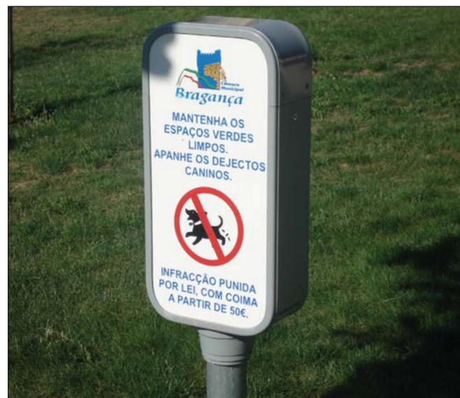
Placa de recomendação aos proprietários de cães.

A limpeza dos espaços tem um efeito multiplicador nos comportamentos sociais, razão pela qual um espaço limpo inspira nos utilizadores maior cuidado. Para além da instalação de contentores, os espaços deverão