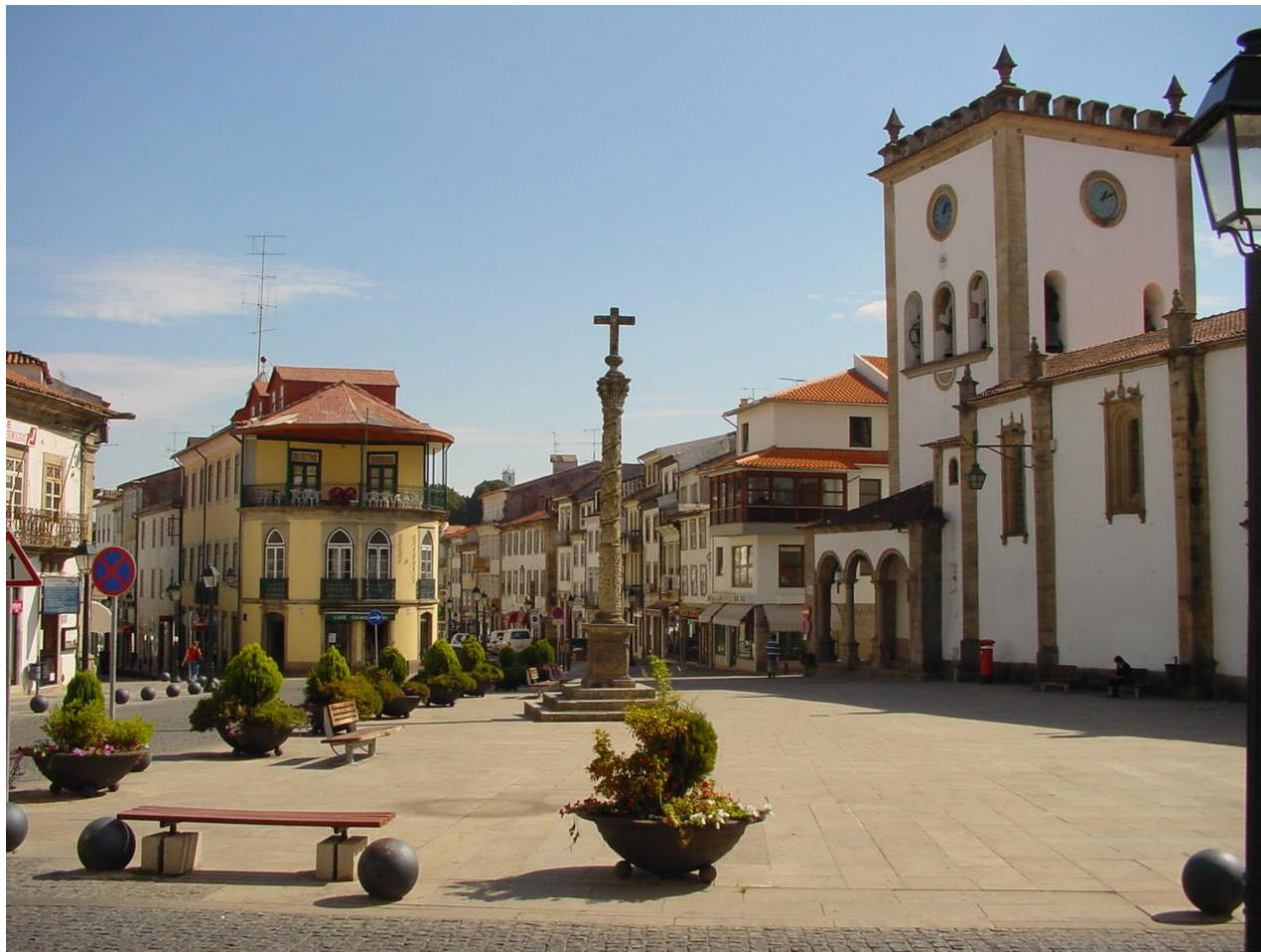
Praça da Sé