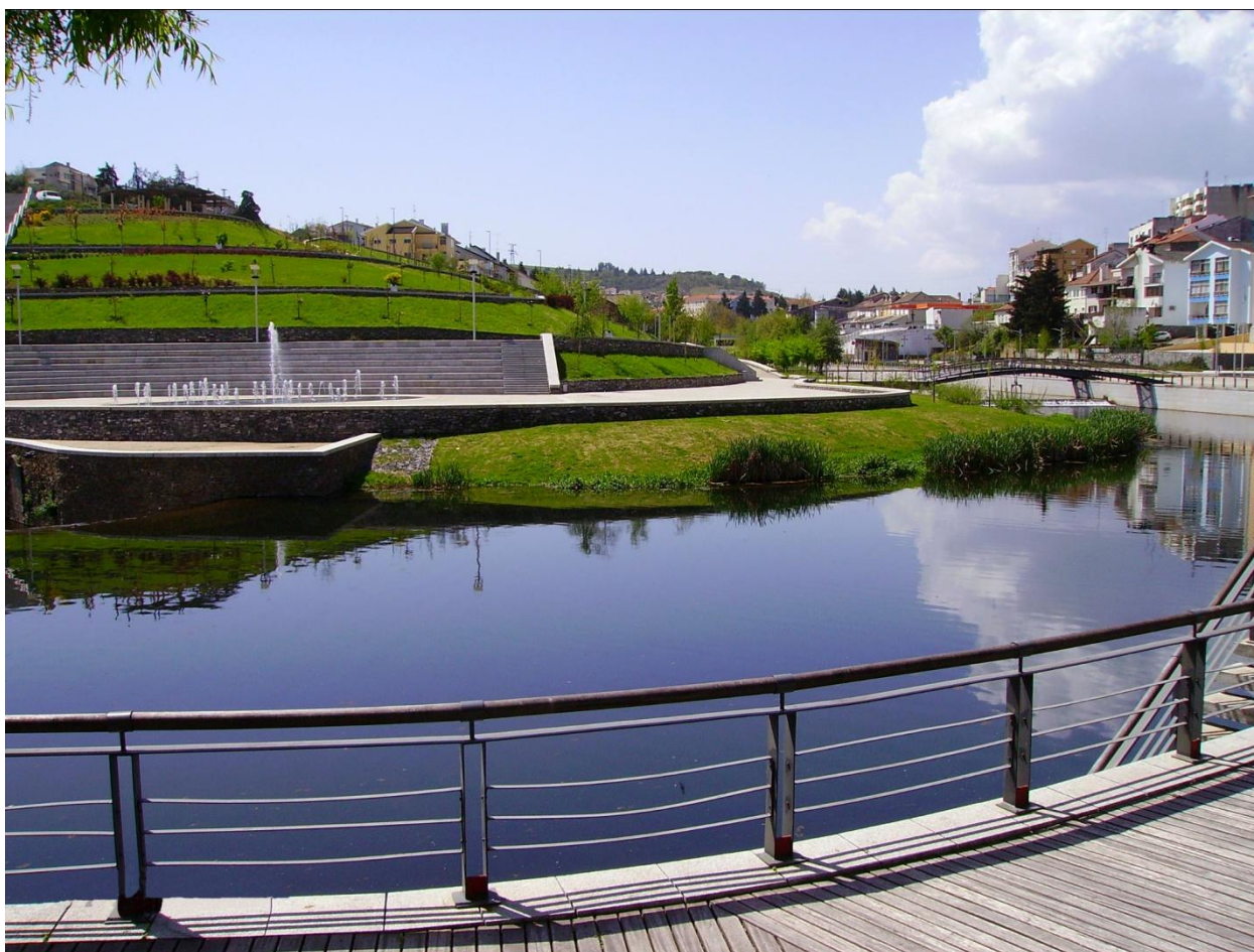
Rio Fervença – Polís