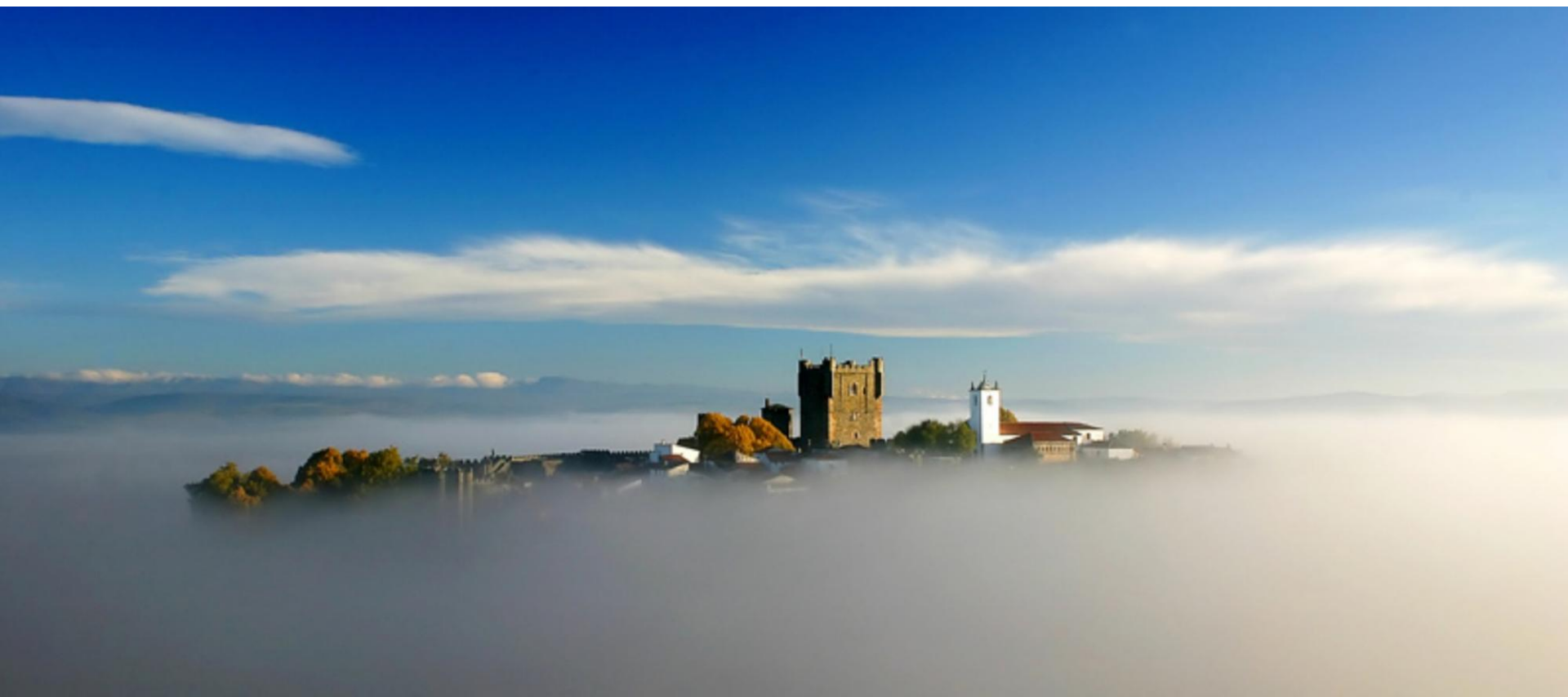
Castelo de Bragança