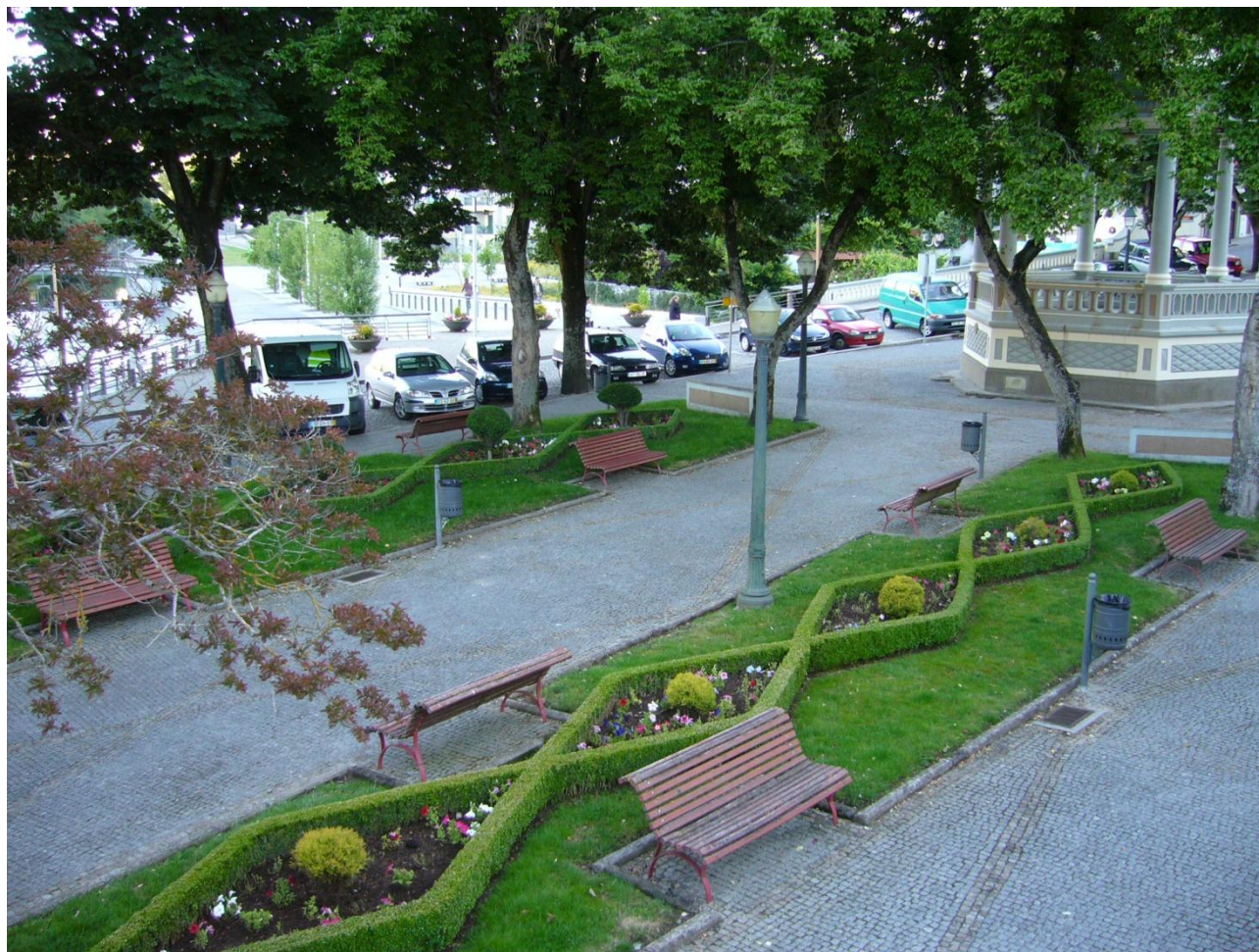
Jardim António J. Almeida