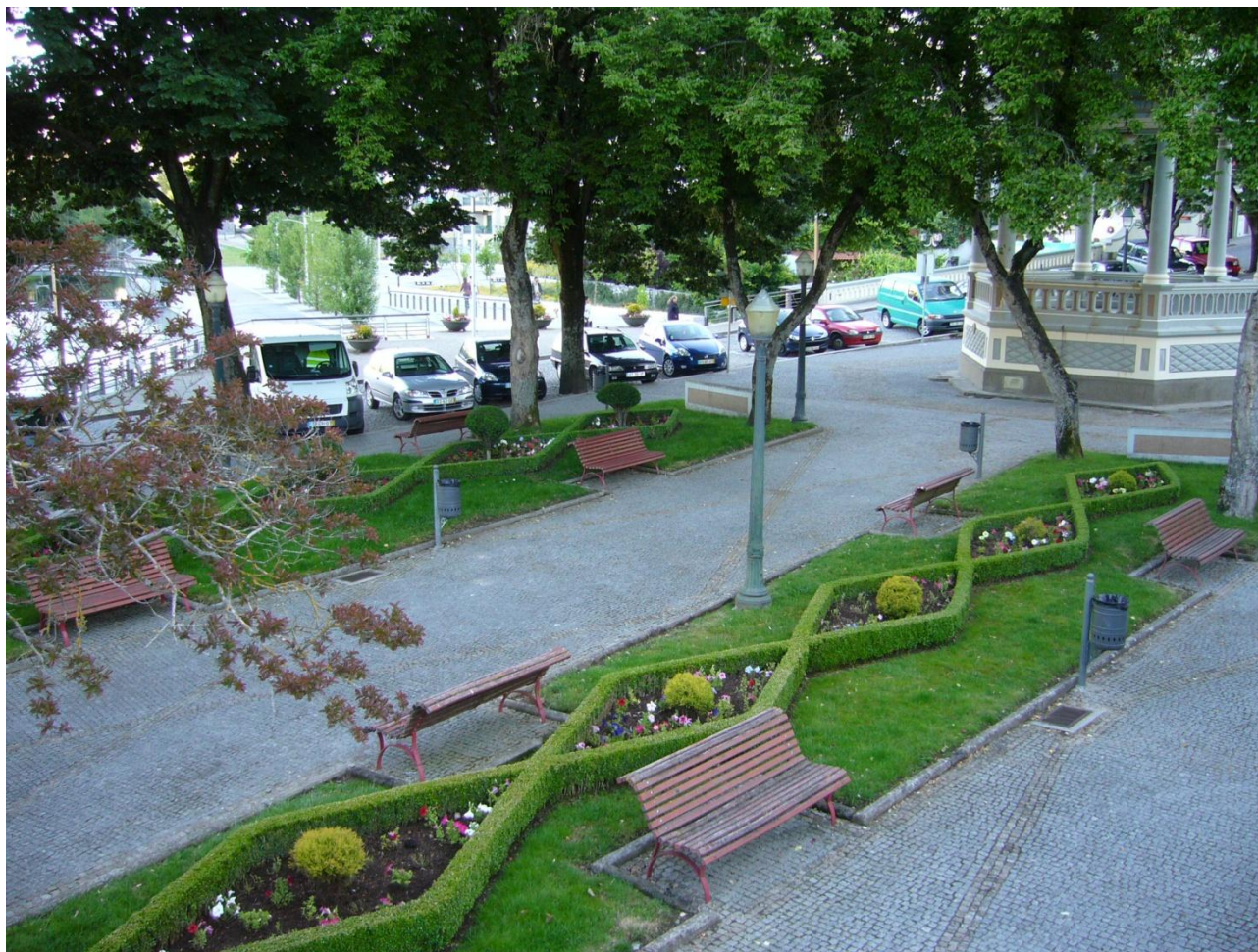
Jardín António J. Almeida