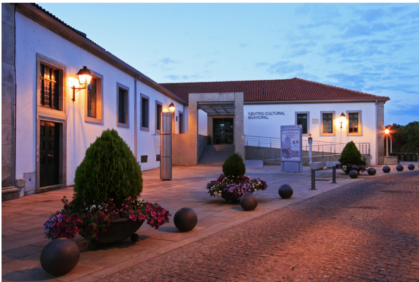
Centro Cultural Municipal