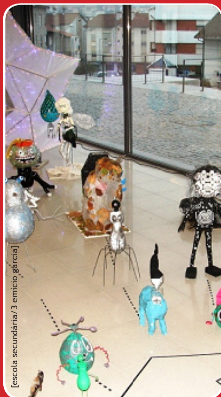
[escola secundária/3 emídio gárcia]